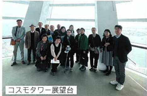
コスモタワー展望台

3日間を通して、関西・大阪経済を牽引した企業の歴史と、今後の経済・観光を活性化するプロジェクトの進捗を目の当たりにし、古の文化に触れることができました。また、大阪道頓堀、奈良東大寺では、成田山参道を上回るインバウンドや関西空港の人手不足も実感しました。