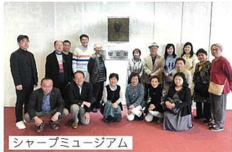
シャープミュージアム