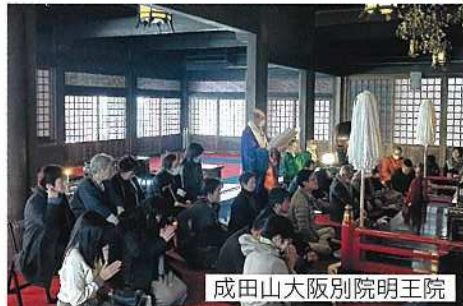
成田山大阪別院明王院